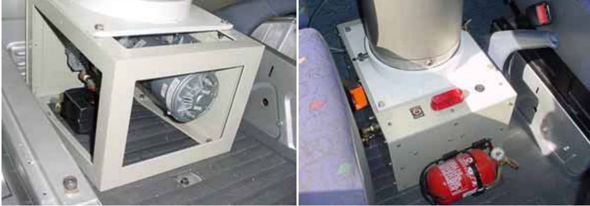
Compressor do Mastro Telescópico, alarmes de intertravamento de operação