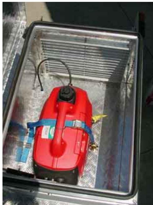
Compartimento do gerador (Gerador Honda 1000W com inversor senoidal)