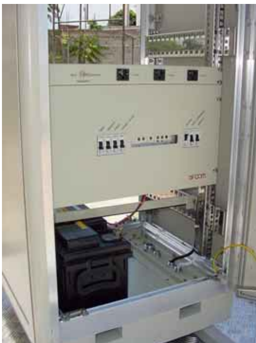
Gabinete com rack 19", bateria, disjuntores e regulador de carga para os módulos solares