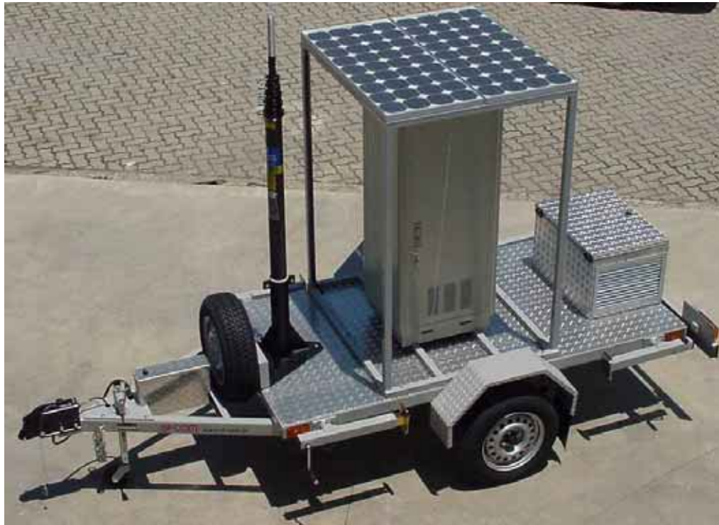
Sistema com mastro telescópico manual de 7,6m, dois módulos solares de 75W, gabinete e compartimento de gerador.

Aplicação: Repetidor, Telemetria, ERB móvel, etc