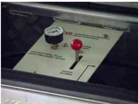
Detalhe do painel com o sistema instalado