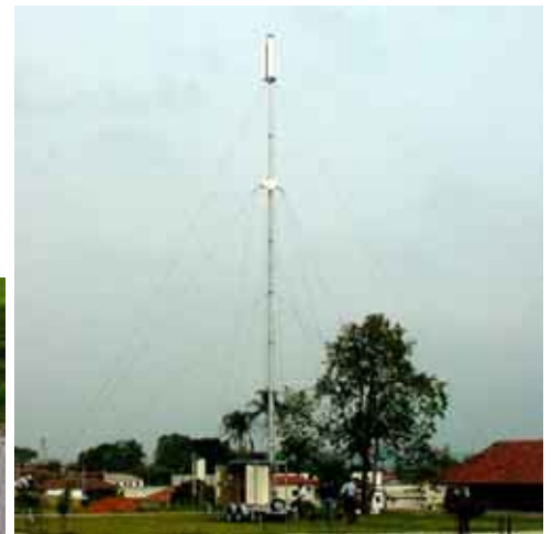
Sistema con mástil de 18,3m y ERB Motorola 4812LT, mástil con anclaje.