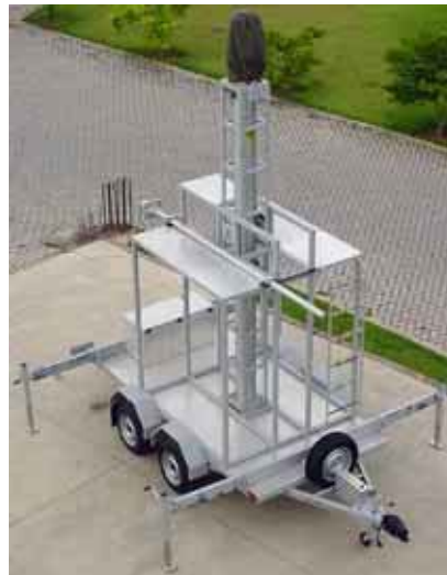
Sistema con mástil de 24,3m y brazos extensores para los gatos mecánicos estabilizadores