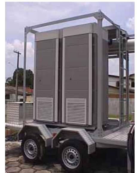
Sistema con mástil de 18,3m y ERB Nokia Ultrasite GSM