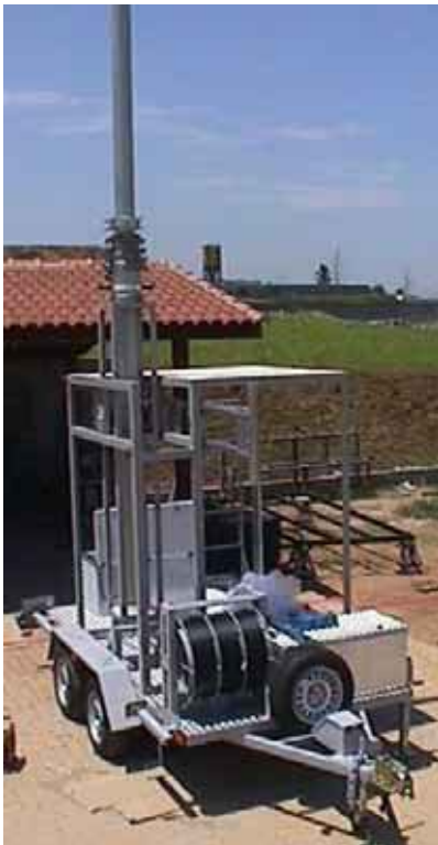
Sistema con mástil de 18,3m y carretel para cableaje