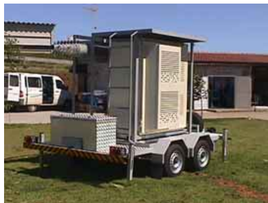
Sistema con mástil de 18,3m y ERB Motorola 4812LT