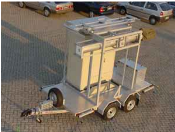
Sistema con mástil 18,3m, Shelter RF COM e Nortel Minicell