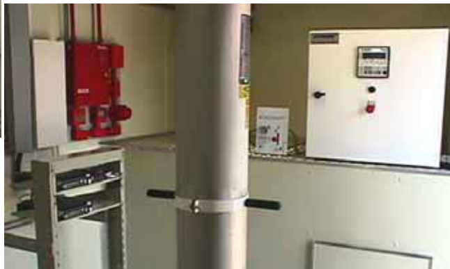
Modems HDSL, Sistema de Detección y supresión de incendio, Control del Mástil y del Grupo Generador