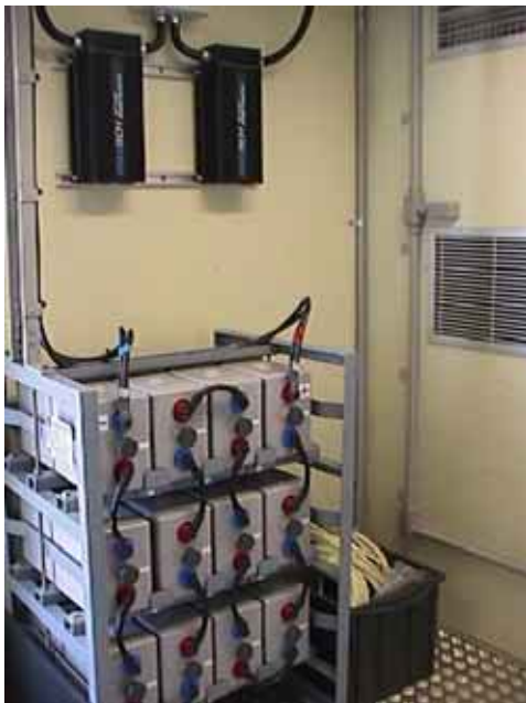
Banco de Baterías e Inversores