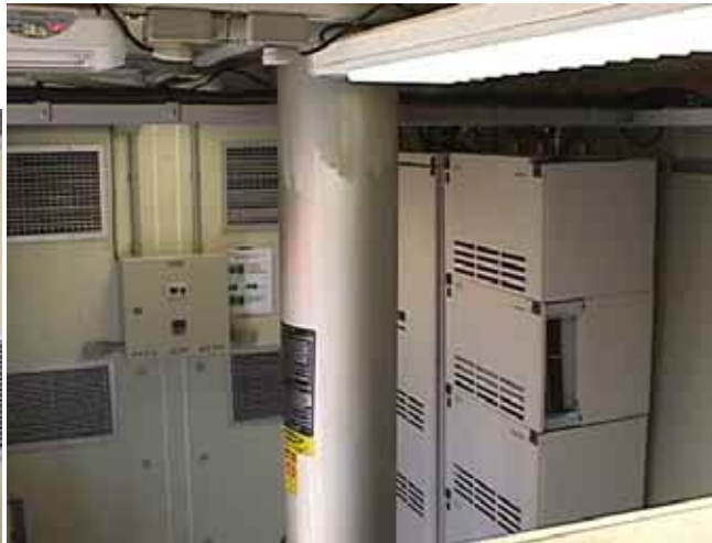
Sistema de control de Aire Acondicionado, Mástil y ERB Ericsson