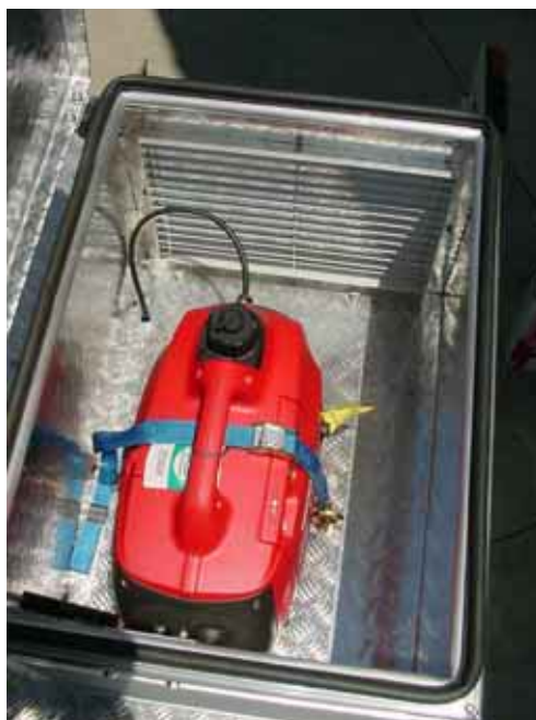
Compartimento do gerador (Gerador Honda 1000W com inversor senoidal)