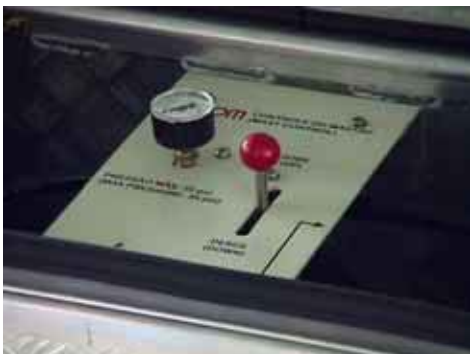
Detalhe do painel com o sistema instalado