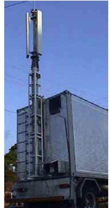
COW 15000 com Caixa e Painel de Controle Pneumático instalados