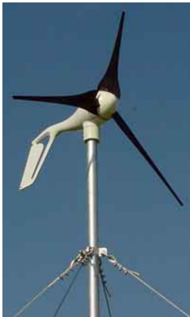
Veja mastro, base e estaiamento para gerador eólico na seção de Acessórios para Sistemas de Energia

A linha Marine utiliza materiais, vedações e acabamento especiais para maior resistência à corrosão.