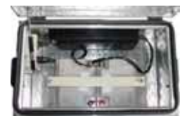
Kit de baterias + carregador