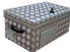
Kit transmissor outdoor (veja em Equipamento de Teste)

Desenvolvemos soluções para qualquer aplicação. Consulte-nos.