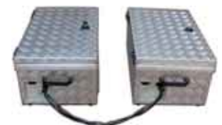
Kit transmissor + Kit baterias