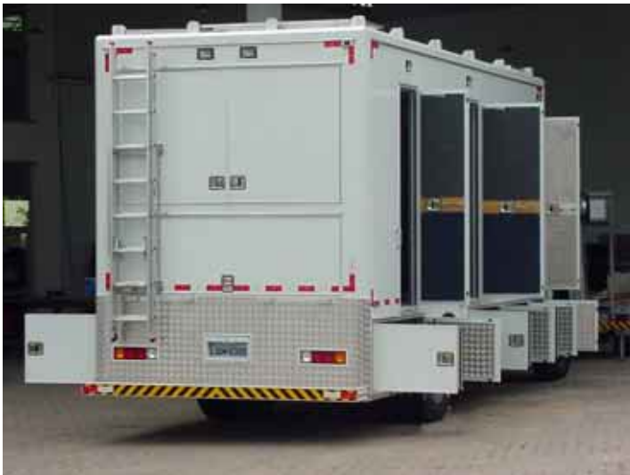
Unidade Móvel de Produção - EFP

Veja em : www.mercedes-benz.com.br www.volkswagen.com.br www.ford.com.br