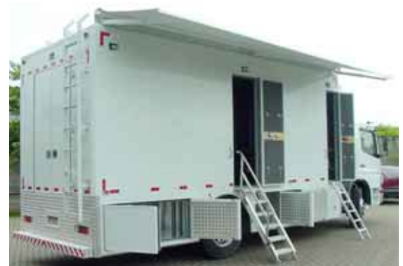
Unidade móvel de produção - EFP