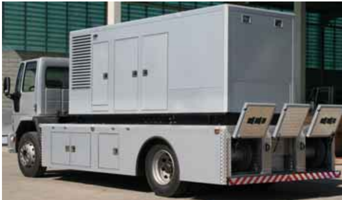
Unidade gerador móvel - UMG