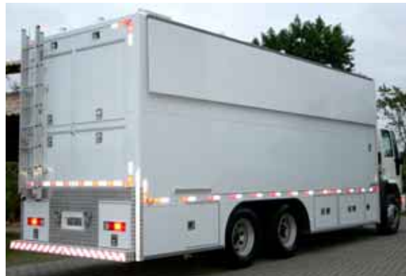
Unidade móvel de produção com Expansão Lateral

Veja em : www.mercedes-benz.com.br www.volkswagen.com.br www.ford.com.br